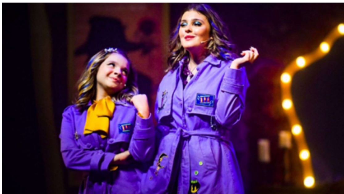
Diversão certa: personagens icônicos irão aparecer no espetáculo, em Goiânia

cia dos personagens continuam sólidos. E a ideia de fazer um filme enquanto estamos no teatro é genial", comenta. A atriz também expressa a expectativa de ser recebida com carinho pelo público de Goiânia. "A essência dos detetives e dos mistérios está sólida".