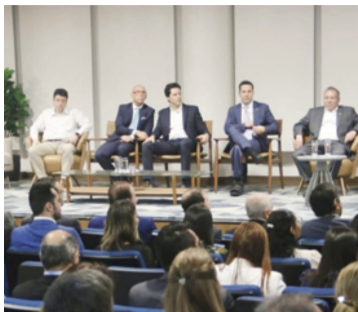
Governador em exercício, Daniel Vilela, e gestores durante lançamento da novo sistema digital

Durante solenidade, realizada no auditório da Organização das Cooperativas Brasileiras (OCB/GO), em Goiânia, Daniel destacou que o novo sistema reflete o compromisso do governo em melhorar o ambiente de negócios em Goiás. "É algo revolucionário e vai no sentido