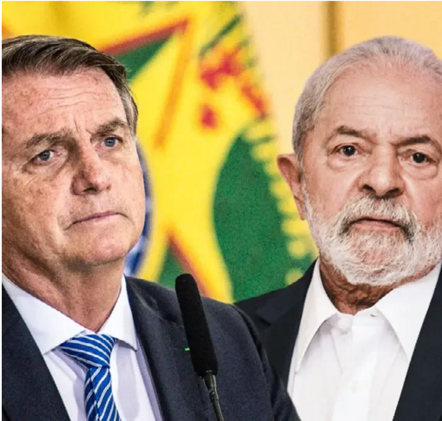
Jair Bolsonaro e Lula: polarização em algumas capitais, em outras, não

“A lógica da eleição municipal é diferente. Essa é a esfera que mais afeta o dia-a-dia do