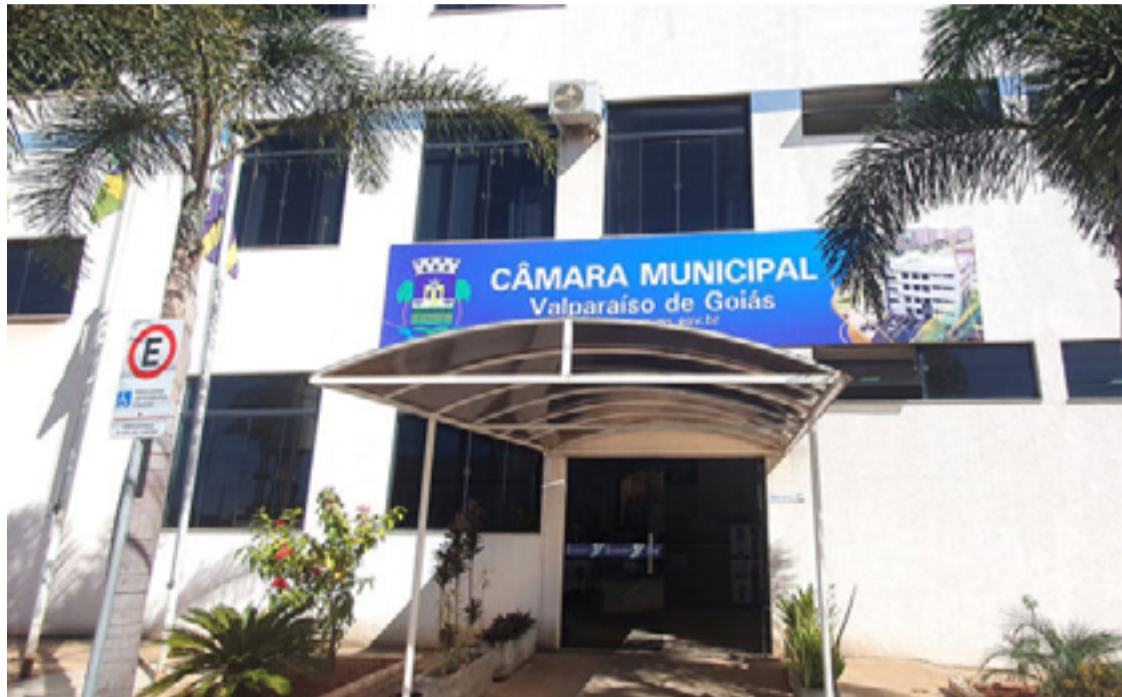
A investigação começou quando o Jornal Opinião do Entorno entrou em contato com a Câmara Municipal, revelando alterações nas informações do Portal da Transparência

A investigação começou quando o Jornal Opinião do Entorno entrou em contato com a Câmara Municipal, revelando alterações nas informações do Portal da Transparência. O número do contrato, inicialmente registrado como 2024005328/2024, foi alterado para 019/2024, que descrevia