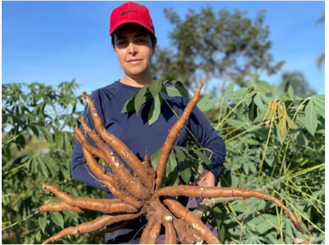
A previsão da cooperativa que plantou 16 hectares neste ano é colher 800 toneladas

Desde então, os cooperados participaram de cursos e já iniciaram a área de processamento da mandioca. Com a mediação da Secretaria de Estado do Entorno do DF, está se preparando para aderir ao Programa de Aquisição de Alimentos (PAA) Estadual.