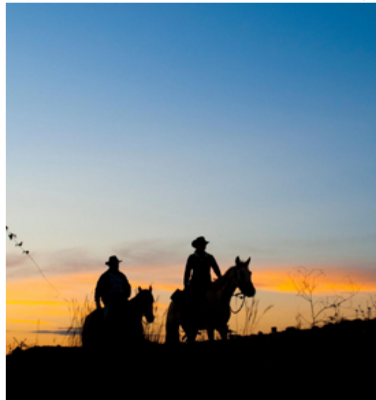
“Leite de Córrego”, de Benedito Ferreira, retrata imaginário do Centro-Oeste