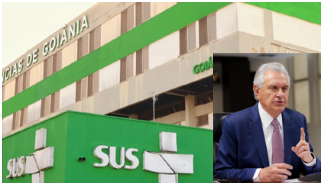
Ronaldo Caiado, governador: após processo, decreto desqualificou organização social que atuava no Hugo

No início de maio, Caiado publicou decreto no Suplemento do Diário Oficial que desqualificava organização social após processo instaurado pela administração estadual e esteve pessoalmente no hospital para cobrar a regularização dos serviços na unidade. Além disso, Caiado adotou um tom austero diante dos problemas que afetavam o atendimento