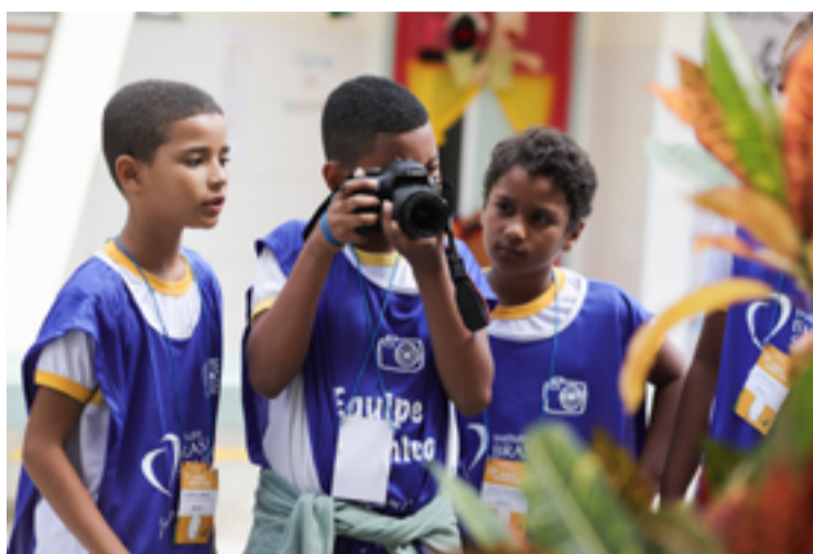
o projeto preparou uma programação intensa, envolvendo desde oficinas práticas até uma capacitação em mediação de leitura

As diversas ações do Plano Bial Brasil Solidário, financiadas com recursos incentivados pela Lei Rouanet, contam com a parceria de instituições e empresas privadas, como Bank of America, John Deere, Ipiranga, BTG Pactual, Newave Energia, Echoenergia, Grupo Equatorial, Palmeirinha Ação Social,