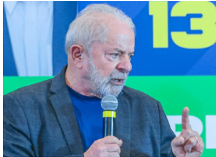
Lula da Silva: obra e campanha eleitoral em Goiânia