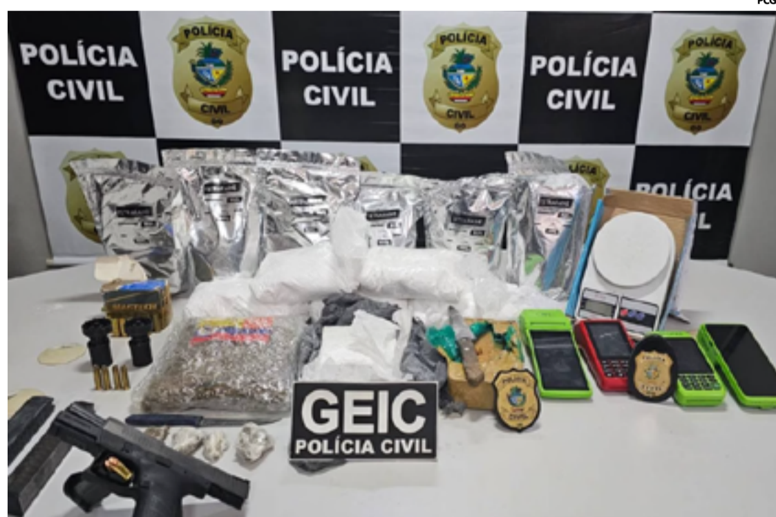
A operação resultou na apreensão de drogas de diferentes tipos, além de diversas armas de fogo, que eram utilizadas para garantir o funcionamento da rede de tráfico.

Conforme apurado pelas autoridades, o narcotraficante utilizava pizzarias e lojas de estética automotiva como empresas de fachada para disfarçar a origem ilícita dos re-