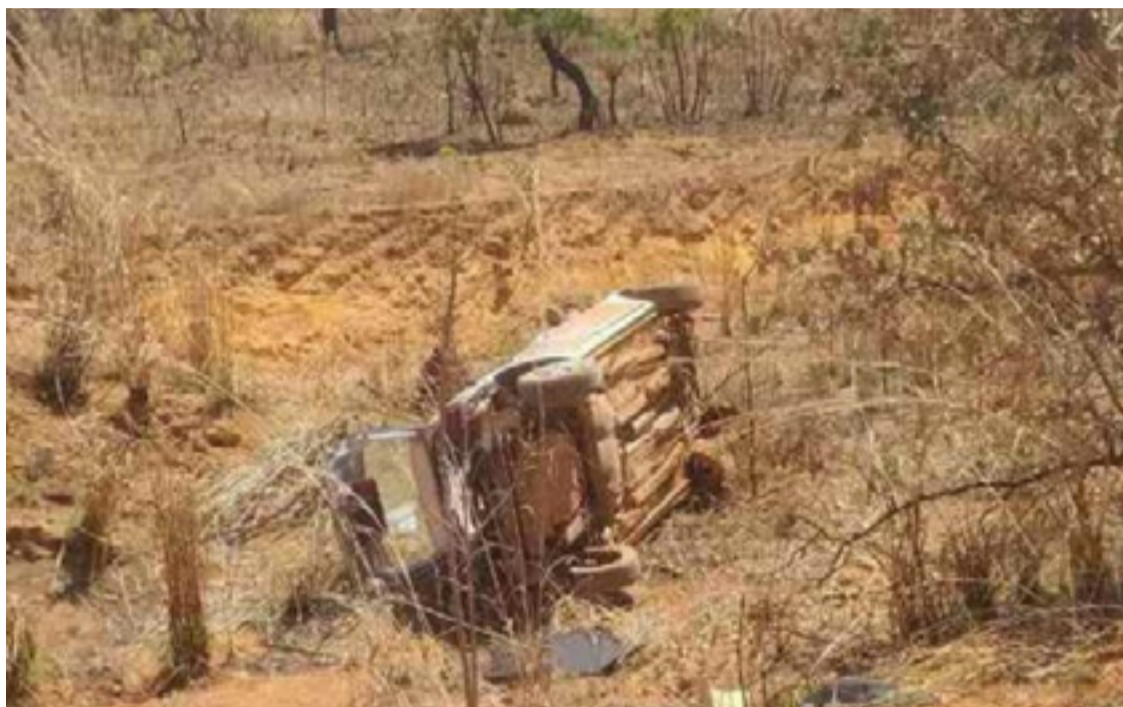
Mesmo após o acidente, os suspeitos abandonaram o carro e fugiram a pé em direção a uma área de mata

Segundo relatos da PMGO, os criminosos desapareceram