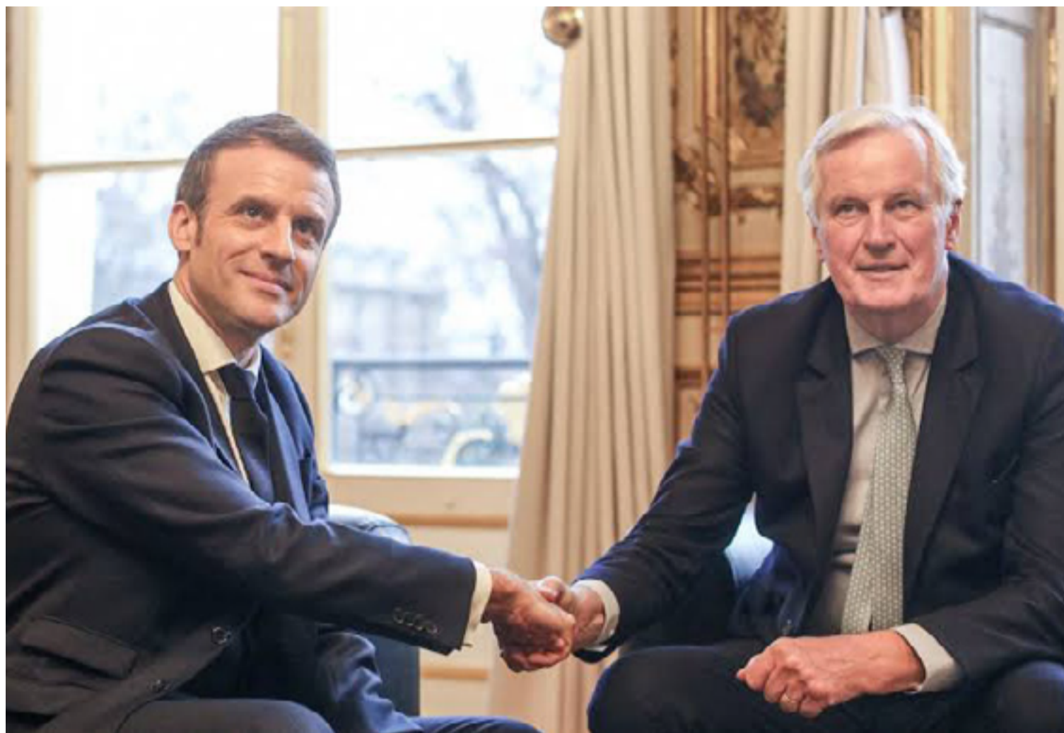
Figura da direita francesa, Michel Barnier ocupou vários cargos ministeriais em gestões anteriores

Por outro lado, a esquerda denuncia uma "negação da democracia". Jean-Luc Mélenchon, líder do La France Insoumise, considera que "a eleição foi roubada do povo francês" e